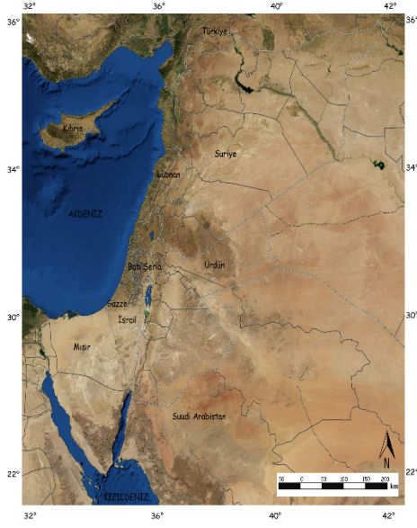
Harita 1. Levant Bölgesi.