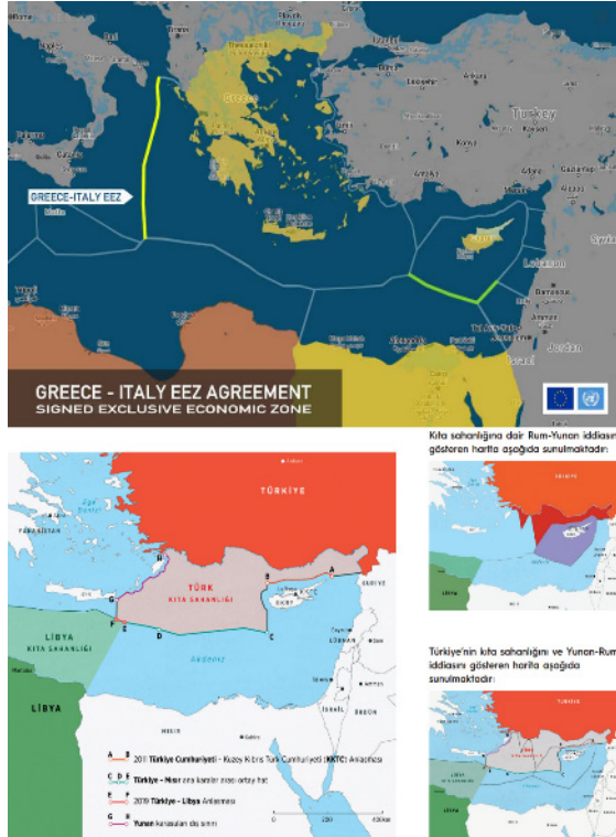
Harita 3. Levant Havzası batısında Türkiye ve Yunanistan'ın Deniz Yetki Sınırları a). Yunanistan'ın Mısır ile imzaladıkları geçersiz MEB anlaşması b). Türkiye-Libya arasında imzalanan MEB anlaşması.